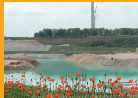
Talus végétalisés de la carrière de Maine-de-Boixe (16).

Espaces naturels, zones de loisirs, protection des individus et des espèces ; les fonctions présentes et à venir des carrières du secteur Aquitaine dépendent bien sûr de la géologie et de ses caractéristiques physiques, mais elles doivent également répondre aux attentes de chacun.