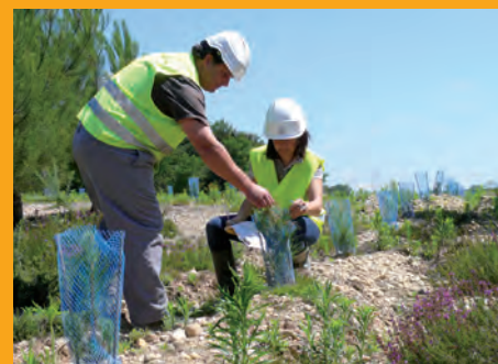
Reboisement sur le site d'Illats (33).