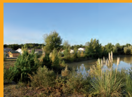
La zone pavillonnaire d'Arsac a été construite sur l'ancienne carrière face au plan d'eau réaménagé.